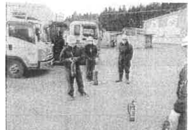
⑨業者による消火器の習得