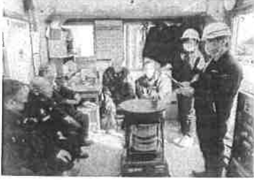
①消防訓練計画説明