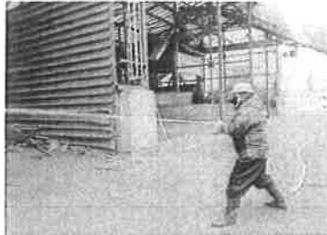
⑤消火ホースによる消火