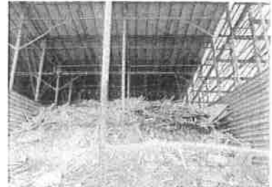
⑥スプリンクラー動作確認