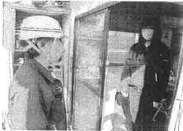
⑦関係機関への通報要請